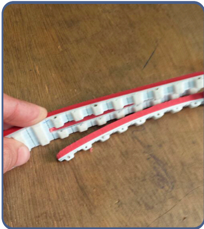
Dentes da Correia