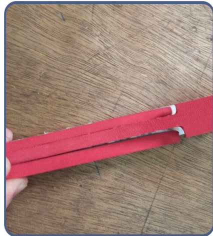
Parte Traseira da Correia